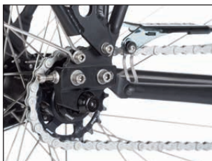
Das geteilte Slider-Ausfallende macht den Rahmen teurer. Ein Kettenantrieb deckelt die Kosten.