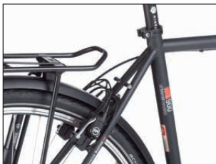
Der Träger ist mit einer 3D-Lasche steif am Rahmen angebunden.

- Geringe Seitensteifigkeit vorn mit Reisegepäck; nur 3 Größen