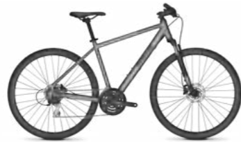
CRATER LAKE 3.7