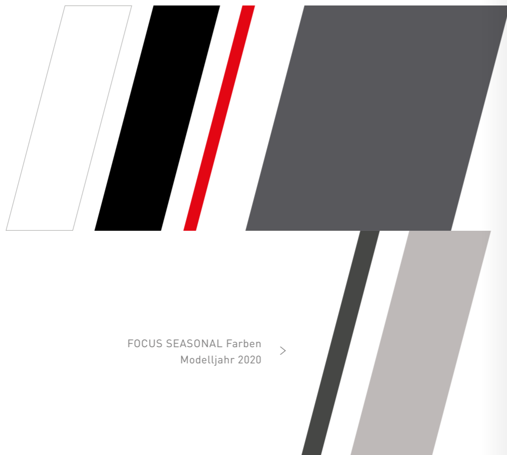
FOCUS HERITAGE Farben >

Die Farbgebung unserer Bikes setzt sich aus drei Farbpaletten zusammen: Die FOCUS HERITAGE Farben stehen für die erfolgreiche Rennvergangenheit unserer Marke. Unsere MULTISEASONAL Farben sind die Quintessenz unseres heutigen Schaffens und bleiben auch über Modelljahre hinweg bestehen. Mit den SEASONAL Farben gehen wir auf aktuelle Farbtrends ein. Die Kombination dieser Farbwelten legt die Grundlage für unser unverwechselbares FOCUS Design.