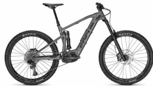
FOCUS SAM 2

„Herausgekommen ist ein hervorragendes E-Mountainbike, das Anfänger und Profis gleichermaßen durch seine ausgewogenen Fahreigenschaften begeistert.“